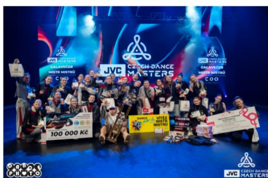
GALAVEČER “MISTR MISTRŮ 2025” - Galavečer Mistr mistrů - Czech Dance Masters | Česká televize