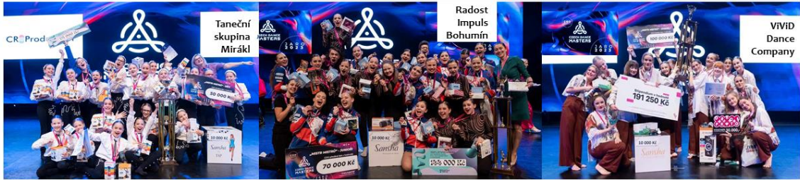
GALAVEČER „MISTR MISTRŮ 2023“ CZECH DANCE MASTERS 28. 5. 2023 - Kongresové centrum Praha

„MISTR MISTRŮ 2023“ absolutní vítěz v kategorii DĚTI, JUNIOŘI, DOSPĚLÍ